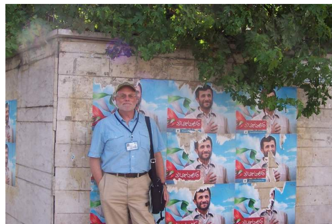
پوشش انتخابات ریاست جمهوری ایران در سال ۲۰۰۹ در تهران.

« بازی شیطانی: چگونه آمریکا اسلام بنیادگرا را به جان مردم انداخت »