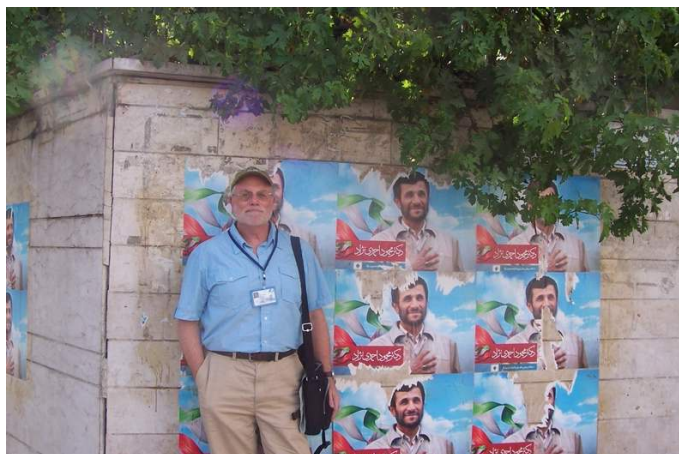
Covering Iran's 2009 presidential election in Tehran.

"Devil's Game: How the United States Helped Unleash Fundamentalist Islam" v